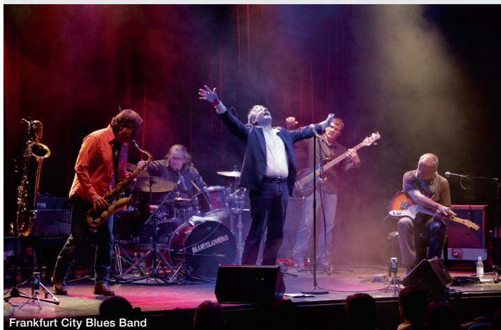
Frankfurt City Blues Band